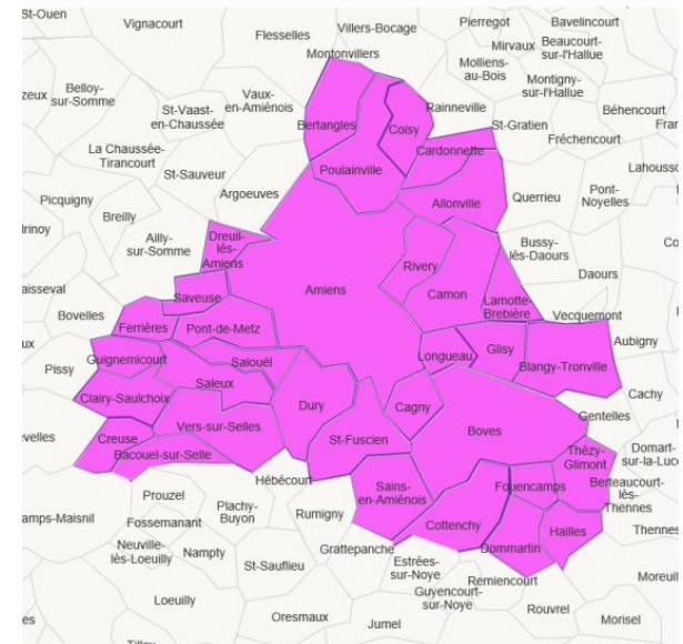
CPTS Grand Amiénois

Absence de C-I Médicales Formelles (Recos SFA)