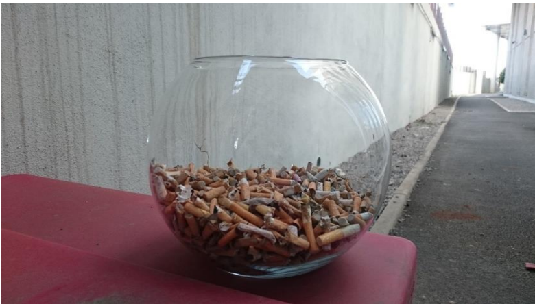
31 mai 2021: Campagne de ramassage des mégots, prise en compte de l'impact environnemental

Recueil des mégots autour de l'établissement, diffusion du projet LSST aux salariés et questionnement sur l'emplacement du futur local pour les fumeurs.