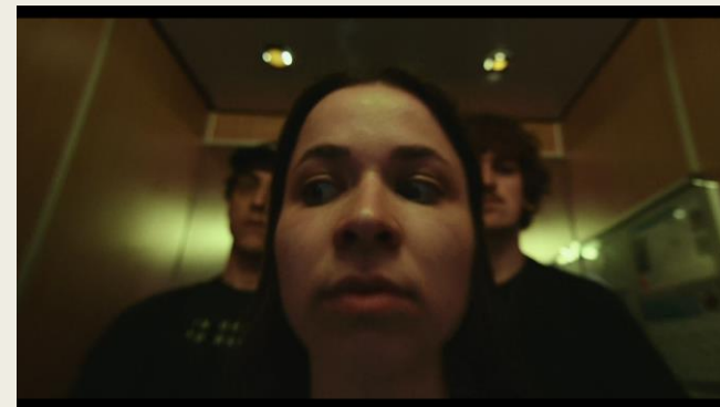
Vidéo 3 : Psychose