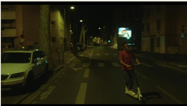
Vidéo 5 : Prise de risque