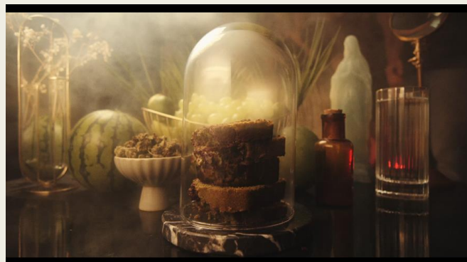
Vidéo 4 : Bad-trip