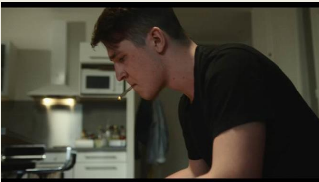
Vidéo 2 : Dépendance