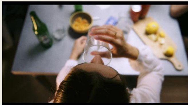
Vidéo 1 : Multiconsommation