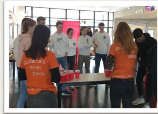
Jeu Pong quizz