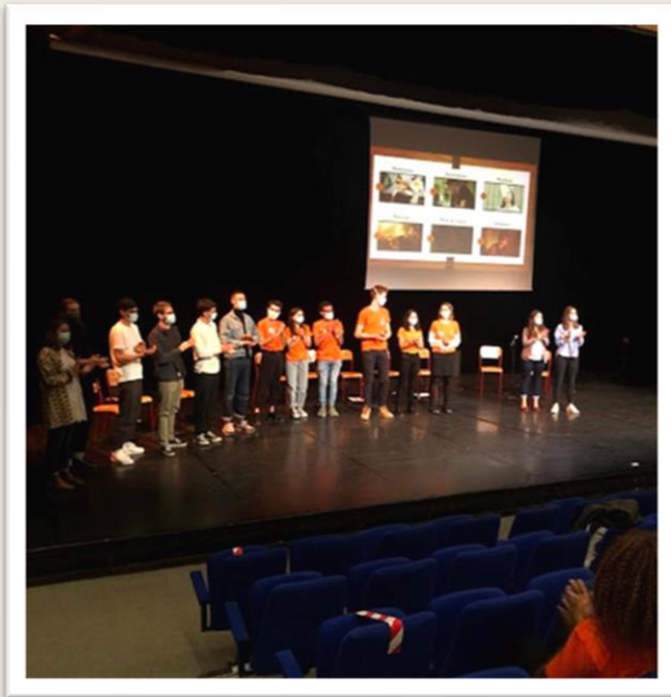
Avant-première ETU prends du cannabis?