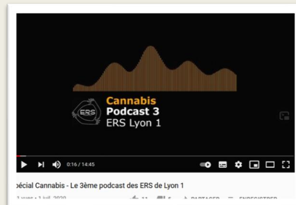
Chaîne de podcast – Spécial cannabis