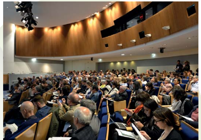
Colloque Hépatites 2016

La détection par TROD des infections VIH et VHC en milieu associatif, et la récente stratégie nationale de santé sexuelle ont été évoquées.